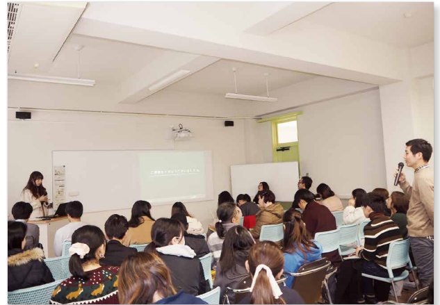
日本人学生や地域のお客様からの質問・意見

研究発表会の様子を撮影したDVDがあります。発表会の様子を見てみたいひとは、連携推進課、留学生担当教員にたずねてください。