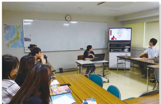
ホームルームの様子

内容によっては、日本語でプレゼンテーションを作成し、感想レポートを書くこともあります。この体験は、留学期間の最後に行う留学生研究発表会（コース必修（20ページ））にの準備としても役立つものです。